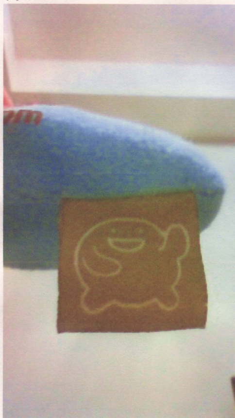
こんなタグがついています。。

意外・・・と言われることもありますが、こういうぽや一つとしたものがお気に入りですが、次回は真面目に抗加齢学会の報告をします。